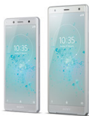
XZ2 Compact XZ2